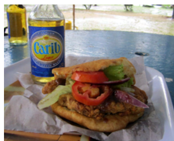
Bake & Shark!