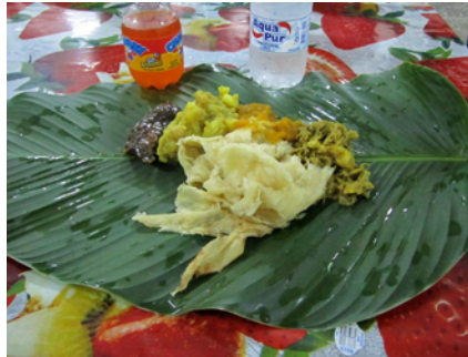
Mat på blad, äts med bröd & fingrar