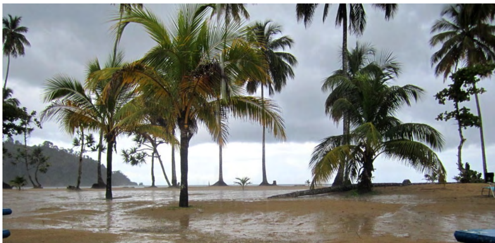
Stranden vid Maracas Bay en regnig dag