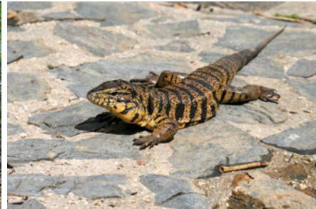
Läcker ödla som inte backade!

Vi beslöt att fortsätta på den slingriga väg vi åkt hit på och köra tillbaka via Trinidads nordkust. Återigen tog körningen långt mycket längre tid än vi räknat med och snart föll mörkret. Men innan dess hade vi turen att hamna bakom en lokal guide som körde runt med två turister. När han stannade för att visa dem bergens speciella djurliv fick vi ta del av lektionen! Vem hade väl någonsin hört talas om till exempel bergskrabbor?