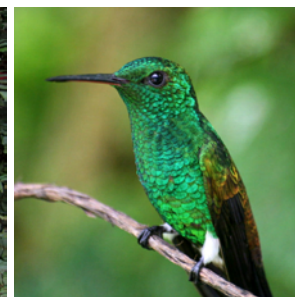
Färgrikt djur- och växtliv!