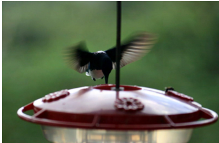
Törstig kolibri, hade inte tid att stanna

I huvudbyggnaden finns en stor veranda och redan här mötte vi det rika djurlivet. Fullt av små kolibrier flög runt oss och stannade upp för att dricka vatten från de behållare som hängde här. I träden runt oss såg vi gott om olika fåglar och på marken fanns, förutom all växtlighet, både aguter och ödlor. Här åt vi en härlig lunch och lyckades boka om vår guidade tur till eftermiddagen. En duktig guide visade oss sedan runt och berättade om både de djur vi såg och naturen här.