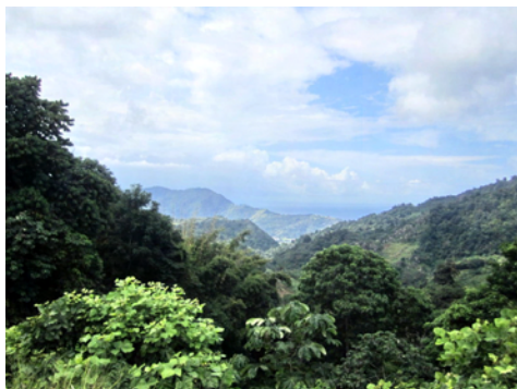
Vackra vyer från höga & gröna höjder

Bilen var varken speciellt modern eller lyxig, en Nissan Sunny med ett antal år på nacken, så hela tiden var vi oroliga för att den skulle börja koka eller att bromsarna inte skulle fungera, vi skulle ju ner också! Det är billigt är hyra bil här och bilarna är därefter. Denna var ändå hyrd hos Exklusive Car. Alternativet heter Econo-Car och när vi frågade hur deras bilar då borde se ut fick vi svaret ”-Det vill ni inte veta!”