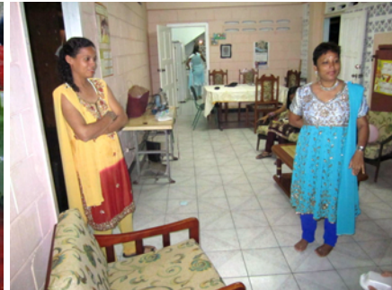
Hemma hos en finklädjd familj

Vi blev inbjudna till en familj och fick se hur de levde samtidigt som de förstås var nyfikna på oss och var vi kom ifrån. Det var mycket stämningsfullt med alla dessa ljus och många Trinidadbor åkte denna kväll till Felicity bara för att titta, precis som vi. Utöver alla ljusen så var det fyrverkerier och minsta barn hade denna kväll små smällare och en typ av det vi kallar tomtebloss.